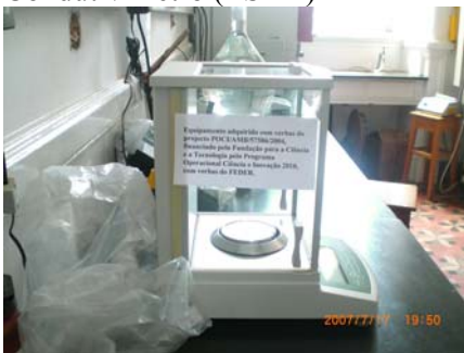
Balança analítica (ISA)