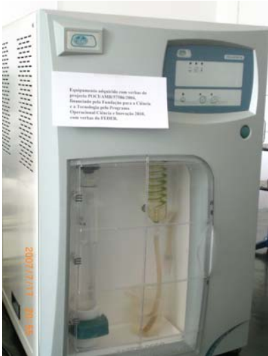
Destilador Pronitro (ISA)