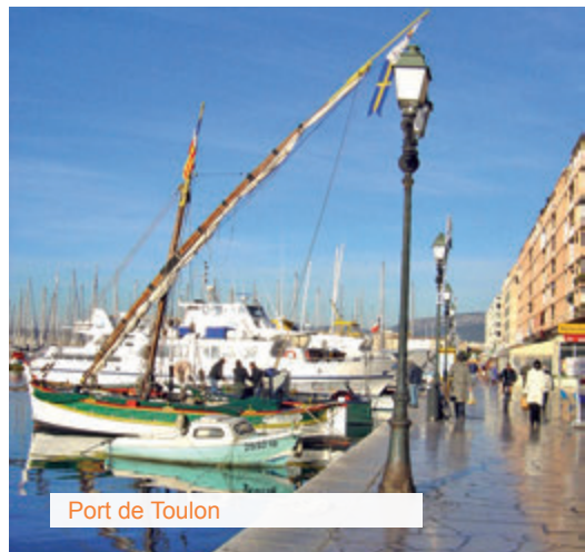
Port de Toulon