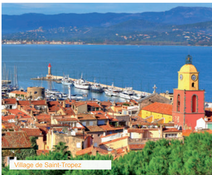
Village de Saint-Tropez