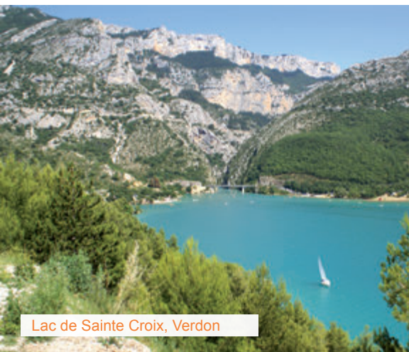
Lac de Sainte Croix, Verdon