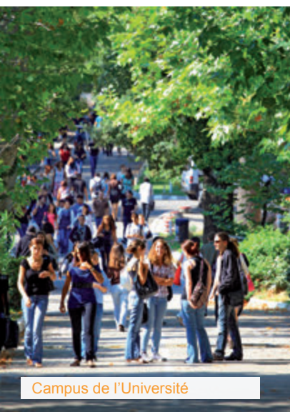
Campus de l'Université