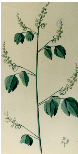
Paullinia cupana Kunth, de nome vulgar Guaraná.

Conferência: O Saber português dos trópicos na evolução do conhecimento das plantas medicinais